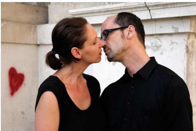
© Brigitte Kovacs, Musenkuss, Fotografie 2011