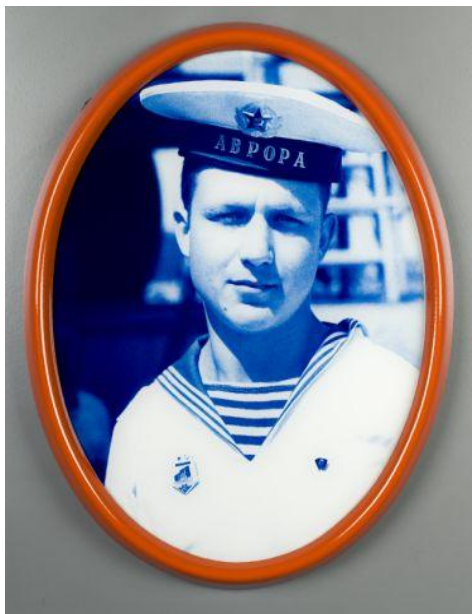
Christian Wachter, „Leningrad, Kreuzer Aurora“ getontes S.W. Foto, 1988, 26 x 20 cm

Einzelausstellungen (Auswahl): 2010 "Impressions D'AFRIQUE", Camera Austria, Graz; 1999 "surplus", Künstlerhaus, Wien; 1997 "Im Referenzmeer tauchen ...", Austrian Cultural Institute, London; Camera Austria, Graz, 1995 "Netz und Knoten", Camera Austria / Forum Stadtpark, Graz; 1994 "ABPOPA/AURORA", ffotogallery, Cardiff; 1993 "Europe", Wiener Sezession, Wien; 1991 "ABPOPA/AURORA", Museum Moderner Kunst, Wien, Museum Folkwang, Essen; 1990 "ABPOPA/AURORA", Camera Austria / Forum Stadtpark, Graz.