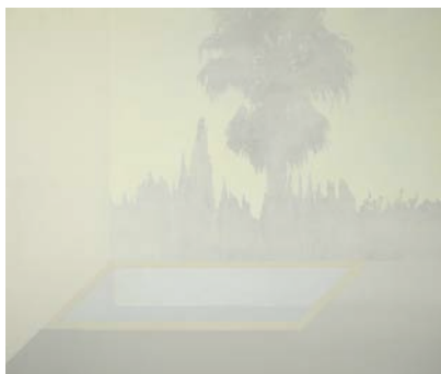
Pool in Encino, 2008

Kontakt: mail@fabianpatzak.net , www.fabianpatzak.net