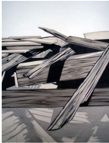
O.T. (found woodage 4), 2009, Tusche und Acryl auf Leinwand, 175 x 130 cm