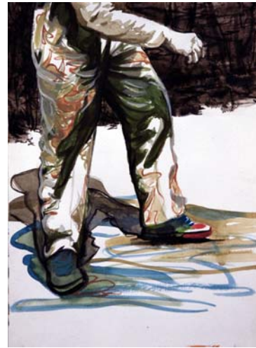
O.T., 2009, Tusche und Aquarell auf Papier, 30 x 21 cm

Die abgerissene Architektur im Bild, durch die Leinwandpaneele in den realen Raum ausgeweitet, stellt das Umfeld dieser perforierten Ex-Heroen dar. Sumpfig, vage und im Zustand des Vermoderns, bietet es jedoch keinen Ausblick, keine sinnstiftende Perspektive. Herausgelöst aus ihrer Story werden Patkowitschs Protagonisten hier zu Männern ohne Mission, deren Charakterblicke noch Restwichtigkeit mitteilen, denen jedoch die Auslöser ihrer Handlung und ihr eigentliches Ziel abhanden gekommen sind, und die ihre Mission schon lange nicht mehr erfüllen können. Sie tragen statt dessen Restempfindungen bereits abgelegter Verkörperungen zur Schau, mühsam zusammengehalten von schlabberigen Kleidungsstücken und zerkrauten Gesichtsausdrücken, von Jacketts und Anzughosen, von Gürteln, Schlipsen, Basecaps, Cowboyhüten und Buddy Holly-Brillen. In der Figur des einen steckt noch der Körper des anderen, Blicke, Rollen und Haltungen überlagern und verschwimmen bis zu alpträumhafter Intensität: Der Filmstar wird zum Doppelgänger, zur schizophrenen Gesichtsbarrakke.