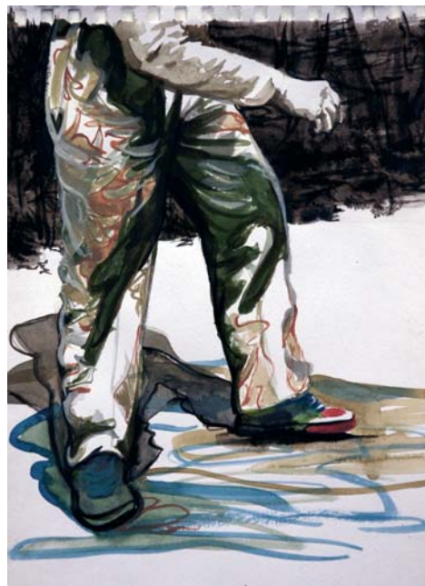
O. T., 2009 Tusche und Aquarell auf Papier, 30 x 21 cm

... sumpfig, vage und im Zustand des Vermoderns, bietet es jedoch keinen Ausblick, keine sinnstiftende Perspektive. Die Leinwände zeigen Reste ephemerer Architekturen, ausgeblichene Bretterstapel und eingefallene Schuppen, ein in grelles Licht getauchtes, ruinöses Ambiente zwischen Verfall und mutwilliger Zerstörung. Herausgelöst aus ihrer Story werden Patkowitzchs Protagonisten hier zu Männern ohne Mission, deren Charakterblicke noch Restwichtigkeit mitteilen, denen jedoch die Auslöser ihrer Handlung und ihr eigentliches Ziel abhandengekommen sind und die ihre Mission schon lange nicht mehr erfüllen können. In „somewhere north to the future“ gibt es keine Erzählung mehr, allenfalls Fragmente vage erinnerter, alpträumhafter bis grotesker Stimmungen ... Tina Schulz