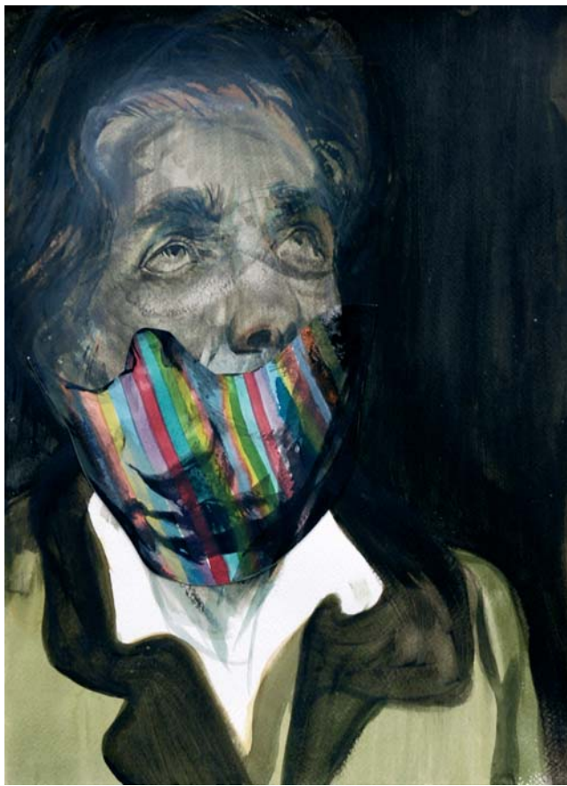
O. T., 2009 Tusche und Aquarell auf Papier, 37 x 27 cm

... sumpfig, vage und im Zustand des Vermoderns, bietet es jedoch keinen Ausblick, keine sinnstiftende Perspektive. Die Leinwände zeigen Reste ephemerer Architekturen, ausgeblichene Bretterstapel und eingefallene Schuppen, ein in grelles Licht getauchtes, ruinöses Ambiente zwischen Verfall und mutwilliger Zerstörung. Herausgelöst aus ihrer Story werden Patkowitzchs Protagonisten hier zu Männern ohne Mission, deren Charakterblicke noch Restwichtigkeit mitteilen, denen jedoch die Auslöser ihrer Handlung und ihr eigentliches Ziel abhandengekommen sind und die ihre Mission schon lange nicht mehr erfüllen können. In „somewhere north to the future“ gibt es keine Erzählung mehr, allenfalls Fragmente vage erinnerter, alpträumhafter bis grotesker Stimmungen ... Tina Schulz