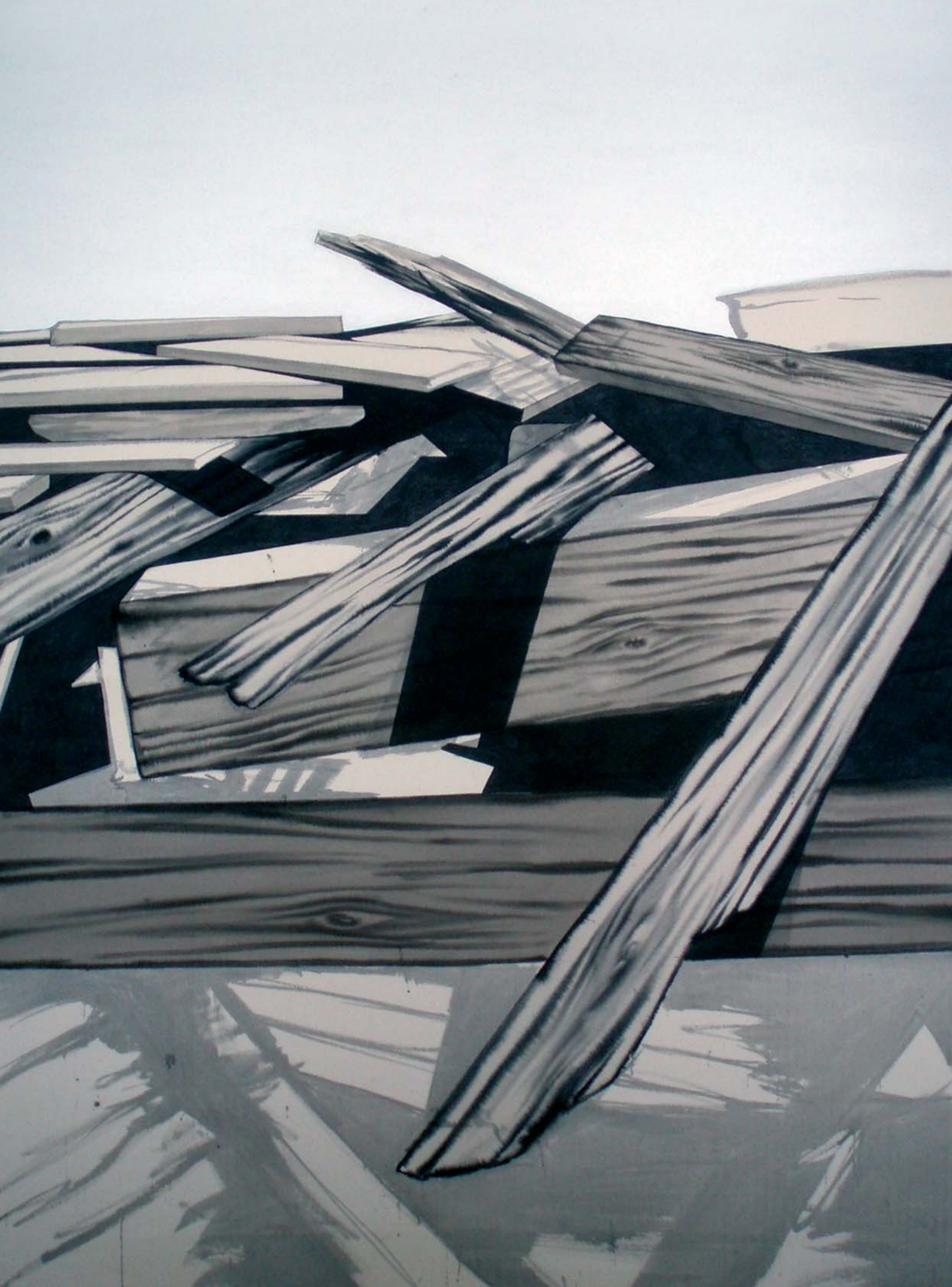
O.T. (found woodage 4), 2009 Tusche und Acryl auf Leinwand, 175 x 130 cm